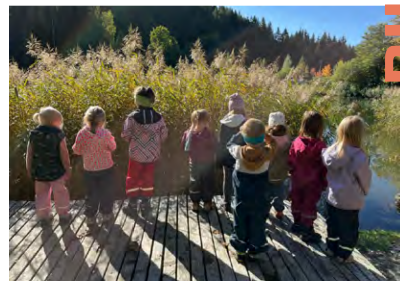
Die Kinder beim Frischluft schnappen und die Natur beobachten

zept an der Mittelschule ergänzt werden. In der Mittelschule neu dazukommen werden die SchülerInnen aus Patsch. Für einen reibungslosen Ablauf rund um die Schule sorgen unsere ehrenamtlichen Schülerslotsen. Intensiviert wurde auch die Zusammenarbeit mit der Diözese. Neben dem Umbau des Widums wird regelmäßig gemeinsam zu Kindergottesdiensten, Prozessionen und kirchlichen Veranstaltungen rund um das ganze Kalenderjahr geladen. Ein wichtiger Schritt für die Sicherheit in unserer Gemeinde ist die Erarbeitung eines Katastrophenschutzplanes und die Einrichtung der Gemeindeeinsatzleitung . Zudem ist das neue Örtliche Raumordnungskonzept ein zentrales Thema für die künftige Entwicklung unserer Gemeinde.