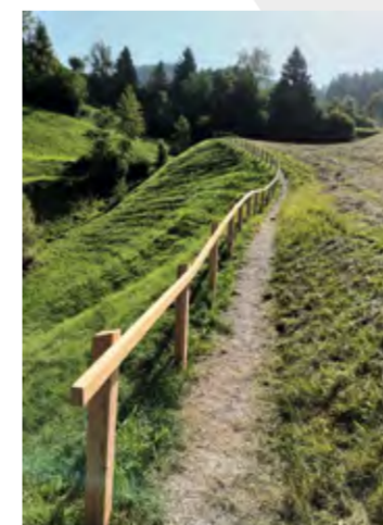
Die Himmelsstiege wurde saniert.