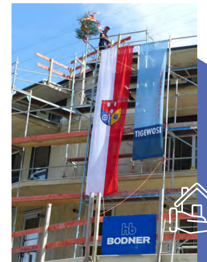
Firstfeier der Wohnanlage in der Haslachsiedlung