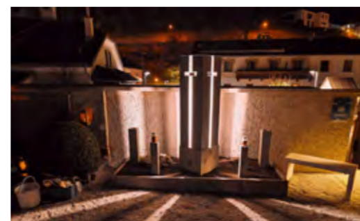
Das von Künstler Carl Felder gestaltete Sternengrab

Kind-Zentrum ins Leben gerufen und wird laufend von der Diözese und dem Familienausschuss betreut. Am Friedhofs-Areal konnte die Beschilderung erneuert und ergänzt werden. Das Thema Verkehr bringt uns alle nach wie vor an die Grenzen des Erträglichen. Gut zusammengearbeitet und vielfach abgestimmt wird sich hier mit der heimischen Polizei und den weiteren Wipptaler Gemeinden. Wir versuchen mit allen uns zur Verfügung stehenden Mitteln Lösungen zu finden und unsere Stimme auf allen Ebenen deutlich zu erheben.