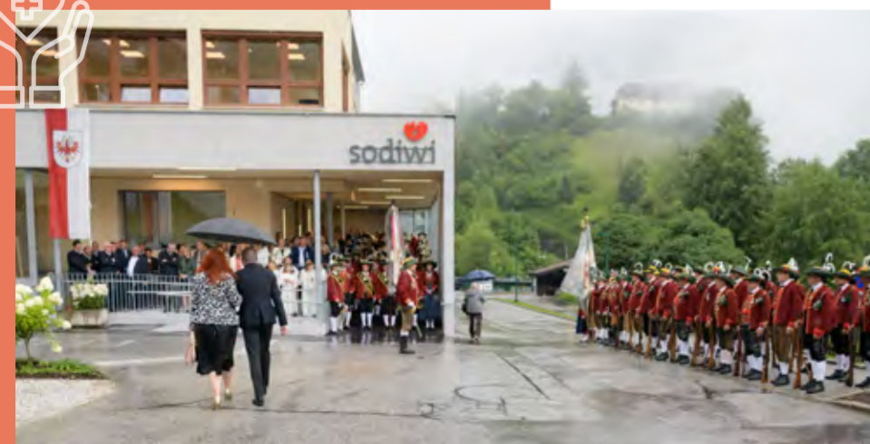
Landesüblicher Empfang bei der Einweihung des neuen Sozialzentrums.

Schwerpunkt wurde auch auf Kultur gesetzt. Mit dem Wipptalherz hat man einen Impulsgeber und ein kreatives Sprachrohr dafür gefunden. Stark gefördert wurde auch die Jugendarbeit . Nach jahrelangen Bemühungen tummeln sich mittlerweile jeden Mittwoch und Freitag rund 50 Jugendliche am Areal des Jugendzentrums und am Jugendplatz beim Pavillon. Dieser wurde durch ein LEADER-Projekt umgesetzt, gemeinsam bei verschiedensten Workshops gestaltet und neu belebt. Die Jugendarbeit wird mittlerweile von drei MitarbeiterInnen in Zusammenarbeit mit der Diözese mit großem Erfolg angeboten. Mittlerweile wird sie sogar über die Gemeindegrenzen hinaus gut angenommen und soll zukünftig und ausgehend von Matrei bei Interesse auch auf weitere Gemeinden ausgebreitet werden. Das Projekt Matreinander soll das Thema in den nächsten drei Jahren gemeinsam mit dem Bildungshaus St. Michael und der Universität Innsbruck auf noch breitere Beine stellen. Die beliebte Jungbürgerfeier wird selbstverständlich weiterhin wichtiger Bestandteil im Veranstaltungskalender der Gemeinde bleiben, ebenso die große Seniorenweihnachtsfeier und die Besuche der Geburtstagsjubilare.