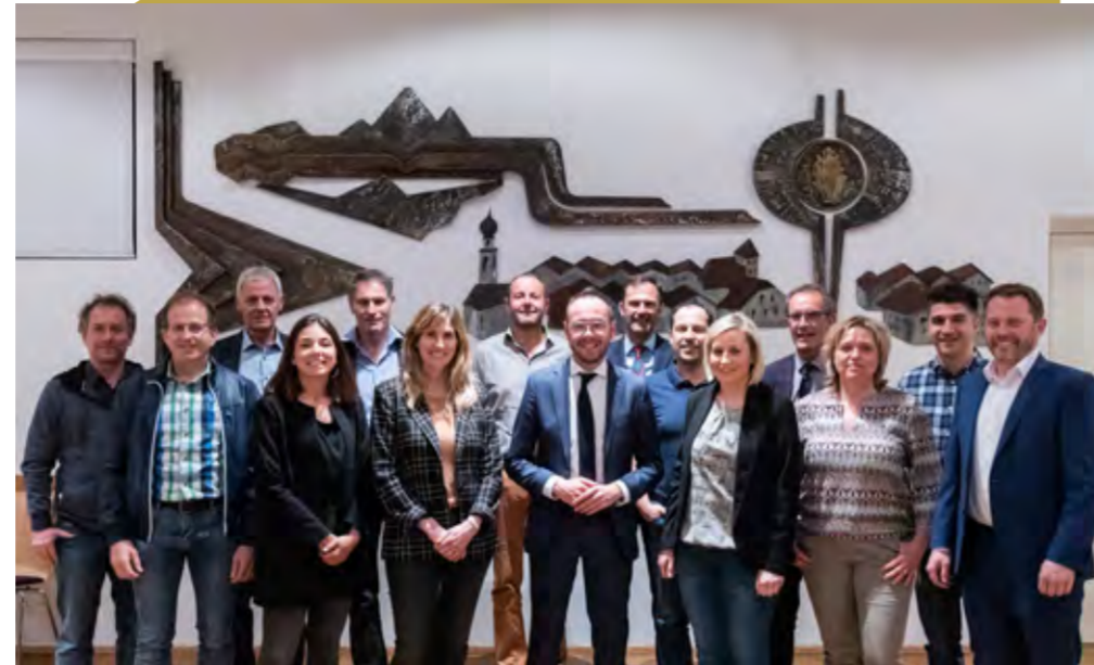
Gemeinsam mit allen Fraktionen und Ausschüssen werden im Gemeinderat Entscheidungen getroffen.